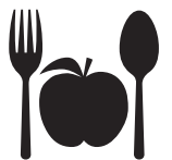
自然食レストラン・カフェ