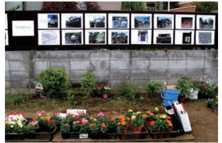
(壁新聞と苗の販売)

先着 50 名分を準備したおみやげの花束は勿論、品物はすっかり売り切れ、人影も無くなって1時頃には片付けムードになってしまいました。