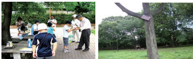
（九品仏川緑道の猫じゃらし公園）

八幡小学校から自由通り経由九品仏川を通過して猫じゃらし公園に行き、復路は浄真寺の外壁をめぐる九品仏参道・奥沢6丁目から学校へというコースを随伴しました。途中、子供たちに住み心地の良い住宅地とは緑被率の高いところだと話して聞かせましたが、子供達の研究発表会で、商店街は緑被率が低いなどと聞かされ忸怩たる思いがしました。（長瀬）