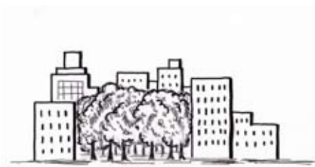
（かつて虔十の植えた苗は今・・・）