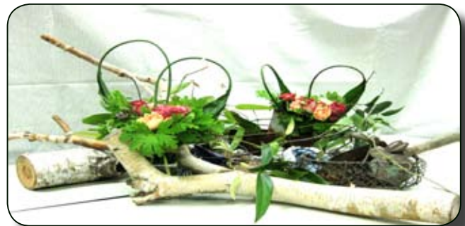
グループ作品の例

ハウス、山菜のフレンチ、ハーブティー」白樺、ガーデン用品を添えて・・・、グループがイメージの動機付けを説明しました。同じ花材、アレンジメントを使っても各グループが大変個性的に、大きな空間、世界を現し目を見張りました。先生の素晴らしい御指導の元、この様に個性を尊重して頂け、正に余韻を心に、楽しい一時を過せ、梅雨空も心晴々と成りました講習会でした。とても楽しかったので今後お友達をお誘いしたいな、と帰路思いました。(興石)