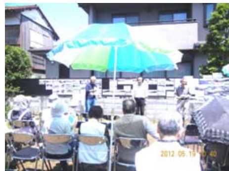
(パラソルの日陰での総会)

恒例のお菓子やおこわ・お赤飯の販売、花苗等の販売を行いました。昨年に引き続き日本支援の台湾茶と川俣町のお味噌の売上は出店者が東北に寄付さ