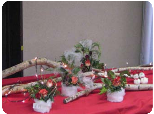
(大勢で歓迎サンタさん)