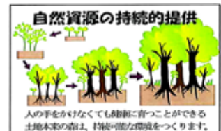
イラスト:中野善久氏・奥ヶ崎朋樹

した森林がスライドに映し出されました。中には巾1mでも森ができていた写真もあり、私達には大変参考になりました。