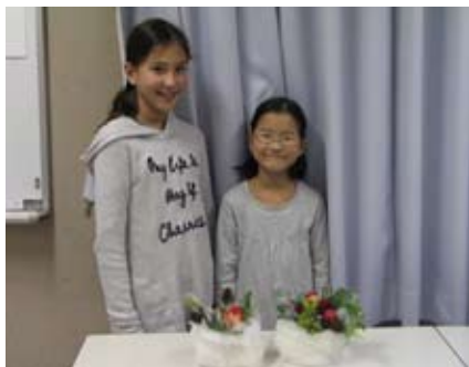
(小学生お二人と作品)