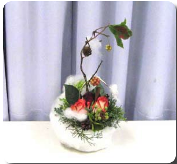
(一人遊びの雪中花)