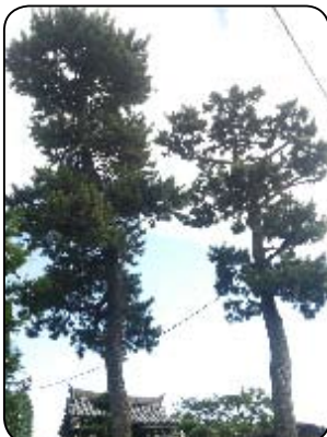
(大音寺山門の二本松)

奥沢の移りかわりを見守り幸せを、願いながら大地に、根をしっかりと踏まえ行き交う人々を元気づけています。