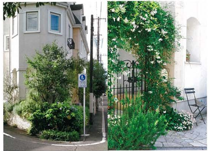
街角のアイストップとなる緑(洋風)