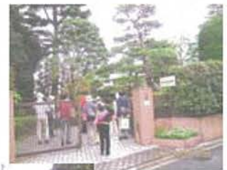
(成城四丁目発明の社市民緑地)