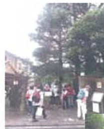
(成城三丁目こもれびの庭市民緑地)

4丁目緑地のトラストビジターセンターで休憩後野川沿いにみつ池・喜多見不動見学。野川を渡り、歴史の街喜多見に入った。念珠玉など珍しい物を見物しながら喜多見氷川神社、喜多見氏の陣屋があった慶元寺、世田谷区初めての農業公園、稲荷塚古墳を見学、次太夫堀公園で解散した。(赤松)