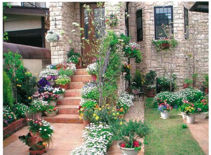
プランター・植木鉢での緑化