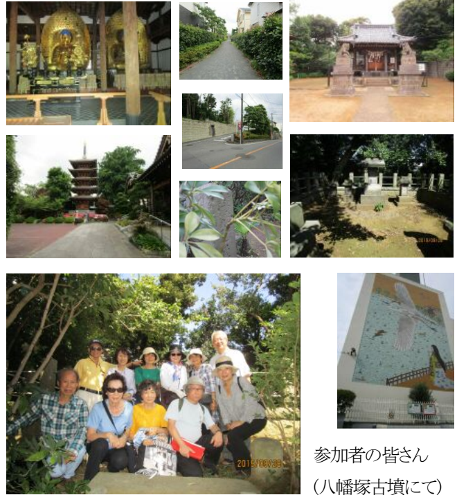
参加者の皆さん (八幡塚古墳にて)