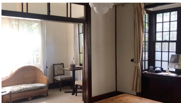
読書空間みかも：特別公開をします。 似顔絵描き、読み聞かせなどもあります。