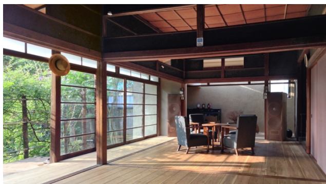
シェア奥沢：「晩秋のつどい」と同時開催です。 オープンカフェで、ピザとカフェラテを提供します。