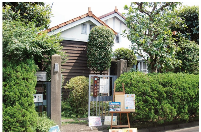
海軍村住宅：読書空間みかもとして公開しています。

このあたりは、今もなお緑豊かな街並みが特徴ですが、当初の区画は約300坪と広く、当時の地図を見ると、緑多い住宅地を示すハッチングとなっており、周辺から際立っています。それが現在では半分に分割されて150坪ほどの敷地に余裕をもって建てられている家はまだ多いエリアです。