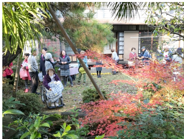
奥沢2丁目小さな森：特別公開をします。 隣のW邸で、お茶をどうぞ。

海軍村住宅などのスポットめぐりのスタンプラリーも行います。詳しくは後日、世田谷区が配付するチラシをご覧ください。（堀内）